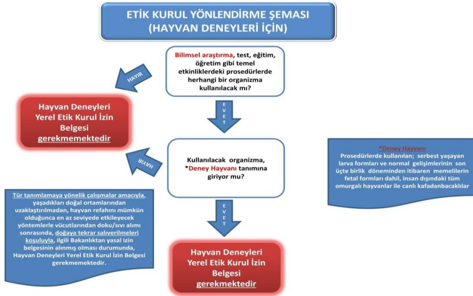
Şekil 1. Etik kurulu onay belgesi için yönlendirme şeması